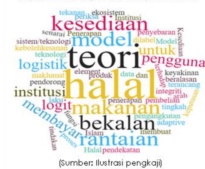
Rajah 2: Teori yang di dalam kajian terdahulu